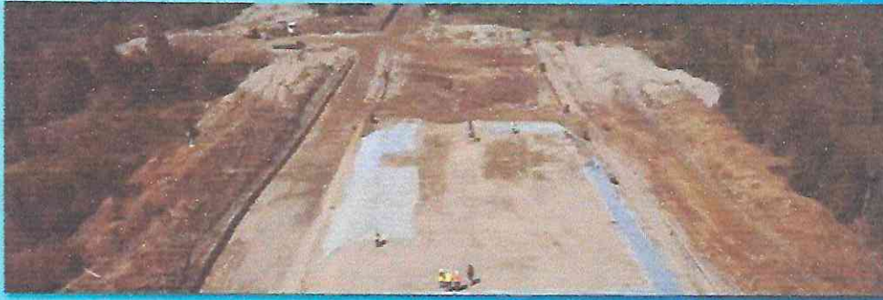
Plan contención Relleno Sanitario Puntra El Roble.