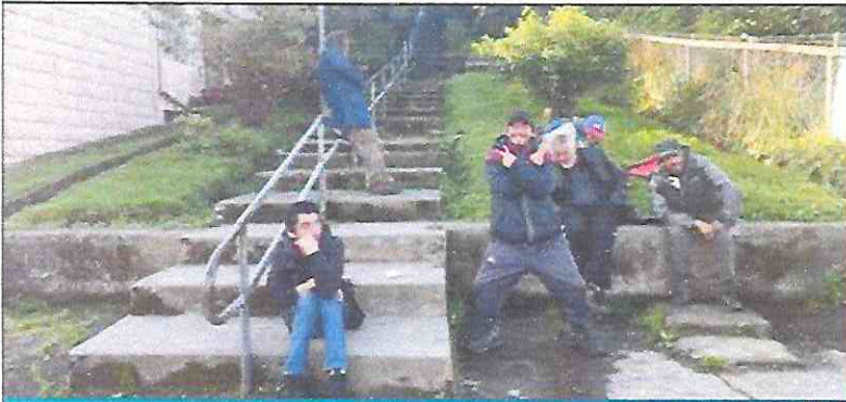
Mejoramiento Espacio Público Escalera Centenario.