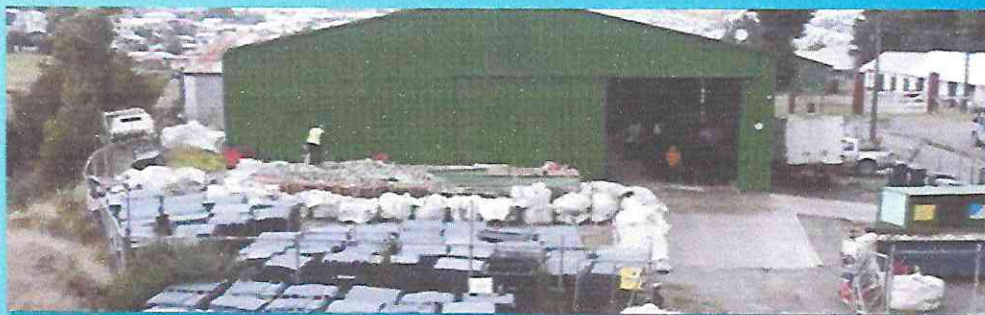
Mejoramiento terreno galpón reciclaje y construcción punto limpio.