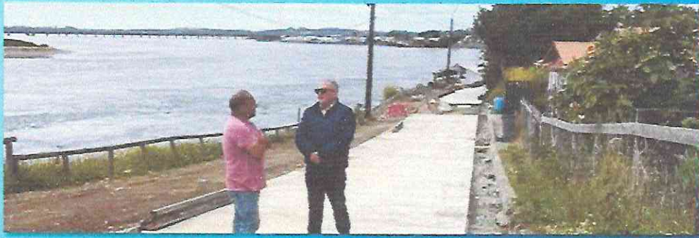
Pavimentación Pasaje A.Latorre, Pudeto Medio, Cruz del Sur.

Constructora e Inversiones Sánchez Jaramillo.