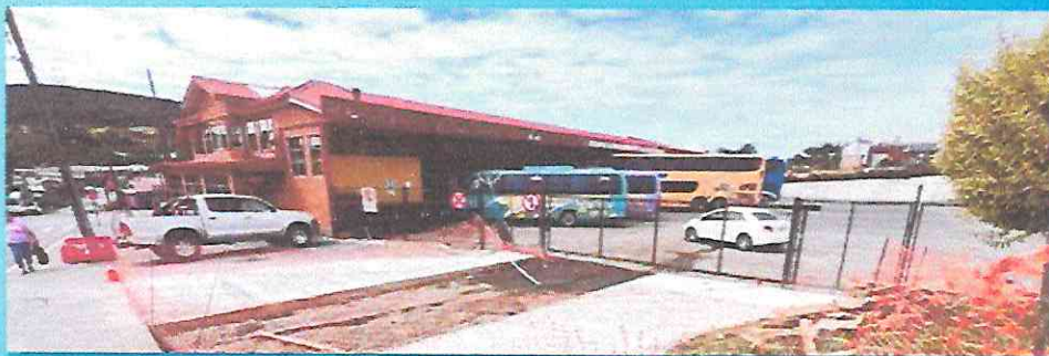
Reposición calzada Terminal de Buses Municipal.