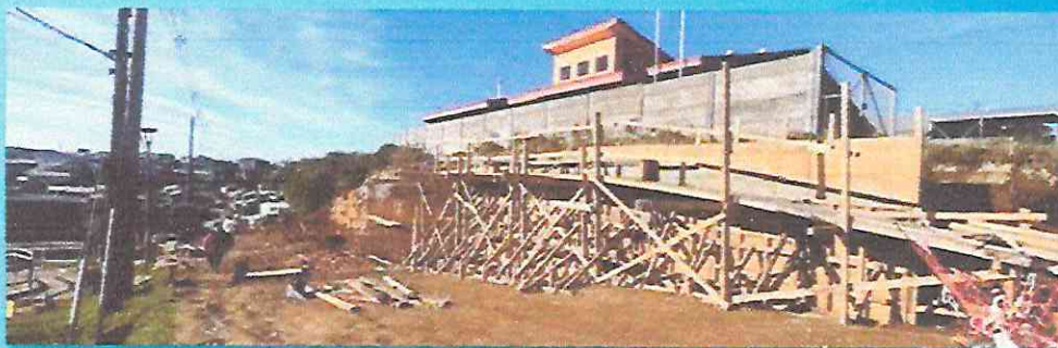
Construcción muro contención calle 31 de mayo.