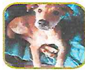
Foxi Parálisis de piernas