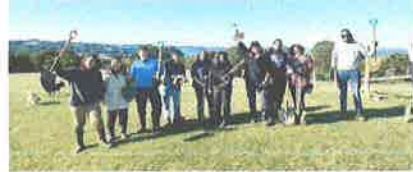
• Reforestemos nuestro Ancud