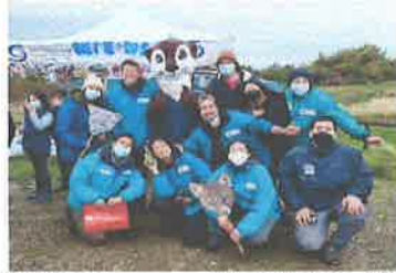
• Mes del Mar, CONAF, SERNAPECSA, MUNI