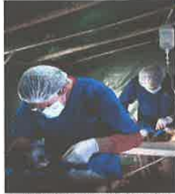
• Esterilizaciones sociales